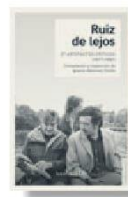
RUIZ DE LEJOS IGNACIO ALBORNOZ (COMPILADOR) Bastante 256 páginas