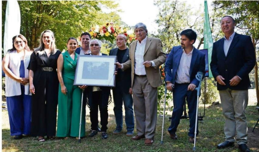
AYER FUERON ENTREGADOS RECONOCIMIENTOS A DISTINTAS PERSONAS QUE HAN APORTADO A LA COMUNIDAD.

Más adelante, la alcaldesa sostuvo que Valdivia no está ajena a la ocurrencia de emergencias e incendios, los que han afectado a vecinos y, en ese contexto, destacó que la comuna fue una de las primeras del país en contar con una dirección municipal de gestión de riesgos y de desastres, "con nuestros planes de emergencia aprobados y vigentes, con convenios de colaboración permanente con Bomberos para capacitar en prevención y actuar rápidos