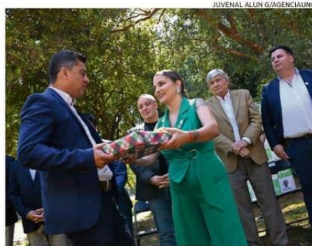
AUTORIDADES Y ORGANIZACIONES SALUDARON A ALCALDESA Y CONCEJO.

En la oportunidad fueron presentadas las siete categorías de Valdivia Destaca 2024. La co-