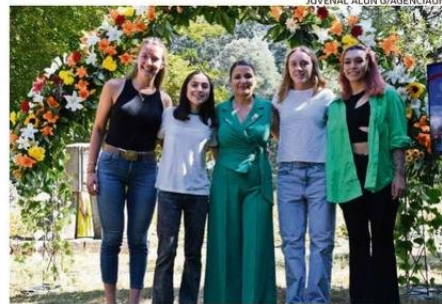
JÓVENES DEPORTISTAS POSTULAN EN CATEGORÍA DE VALDIVIA DESTACA.

En ese contexto, es que mencionó algunos elementos