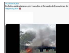
Dependencias del Ejército en Colina no fueron "atacadas" el jueves.