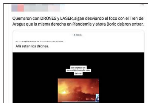
Absurdas conspiraciones sobre el incendio incluyeron hasta ovnis y rayos láser.

Asimismo, se compartieron supuestas denuncias contra partidos políticos ("el PC está pagando por incendiar Valparaíso") y discursos de odio contra migrantes, especialmente venezolanos.