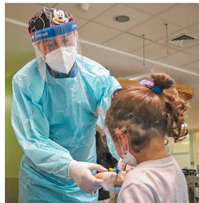
La mayor cantidad de casos se presentó en menores de 4 años que representó un 68,3 por ciento del total de los casos.

En este contexto, la autoridad sanitaria regional detalló que "Si revisamos el agente etiológico para estas enfermedades, vemos que el Sars Cov 2 está presente en 26 casos analizados, lo que corresponde a un 43,3 por ciento de las enfermedades de origen respiratorio observadas en ese periodo de tiempo, Adenovirus corresponde a un 26,6 por ciento, Parainfluenza 23,3