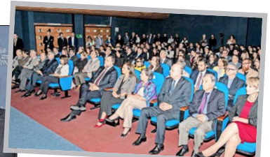
El Aula Magna de la Casa Central de la Universidad del Alba reunió a un centenar de académicos, estudiantes, funcionarios e invitados especiales.